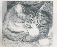
Gato responde a figuras públicas portuguesas num vídeo do YouTube

Edite Estrela, Francisco Pinto Balsemão e António Capucho, entre mais de 200 figuras públicas, subscreveram uma petição a solicitar uma campanha nacional de esterilização de cães e gatos, para prevenir o abate de animais abandonados. A petição foi mal recebida pelos gatos, que acesalharam no YouTube os políticos portugueses a esterilizarem-se a eles próprios, para ver se a dívida portuguesa não sobe ainda mais, e Francisco Pinto Balsemão a esterilizar o rabicho de cabelo à marialva que lhe cobre o pescoço, para ver se debia de parecer um guitarrista dos Scorpions, tudo isto enquanto ocorriam ao plano os maiores sucessos da Adele e da Ferreira. VE